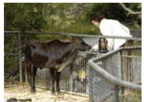
Der Basler Zolli erfreut sich grosser Beliebtheit.