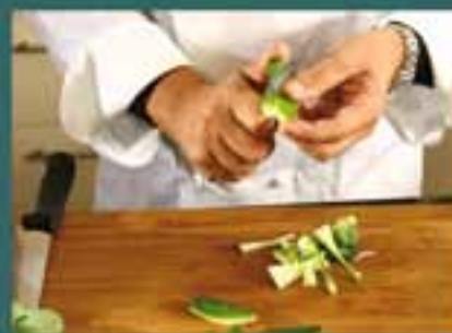
Stellenangebote und Stellengesuche