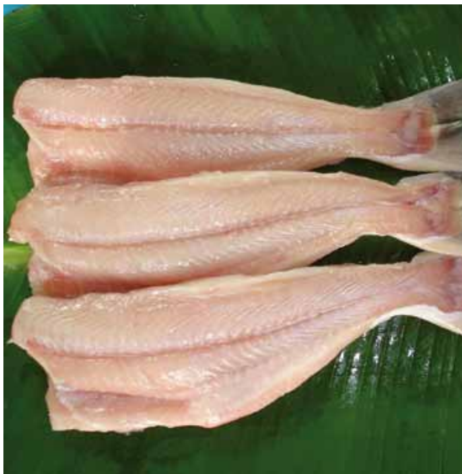
■ In Europa werden immer mehr Fische aus fernen Ländern angeboten. Besonders beliebt ist der Pangasius, ein Haiwels aus Südostasien.

Das Max Rubner-Institut in Hamburg hat nun die «neuen» Fischarten genauer untersucht, um Kriterien und Daten für die Lebensmittelkontrolle zu bestimmen. Bei den bisher untersuchten Arten, Doraden aus dem Senegal und Pangasius aus Vietnam, waren die Ergebnisse erfreulich. Alle Proben entsprachen in Frische und Qualität den gesetzlichen Vorgaben. Die Deklaration war ordnungsgemäss. Einzig die Angaben über erlaubte Zusatzstoffe waren nicht immer vollständig.