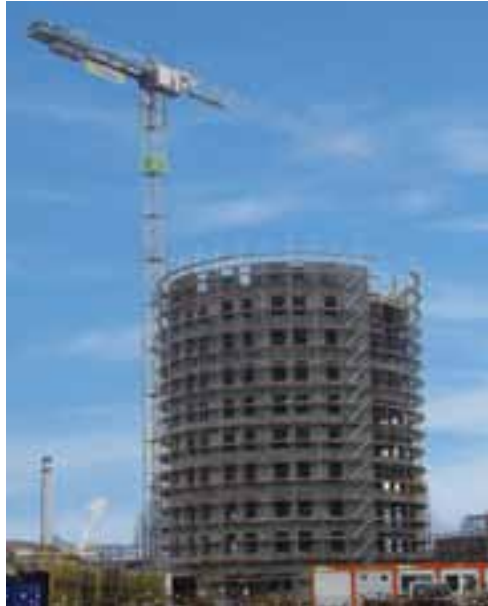
Das Wachstum der Baselieter Hotellerie findet vor allem im unteren Kantonsteil statt. 2010 eröffnet in Pratteln ein Vierstern-Hotel mit 175 Zimmern.

Bis Ende 2010 kommt es zu einer Ausweitung des Zimmerangebots von rund 15 Prozent (Courtyard by Marriott in Pratteln). Sehr viele Gäste der Baselieter Hotellerie unterscheiden sich kaum von denjenigen in der Stadt: Es sind Touristen, die unsere Stadt aus geschäftlichen oder privaten Gründen besuchen. Da verwundert es nicht, dass fast 200'000 Logiernächte im unteren Baselbiet anfallen.