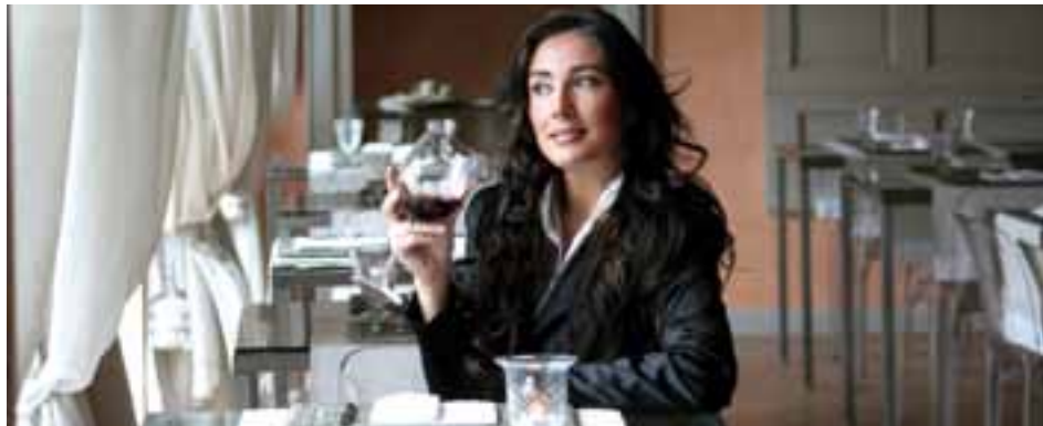
■ 15% der Betriebe überlegen sich, den Mitarbeiterbestand abzubauen.