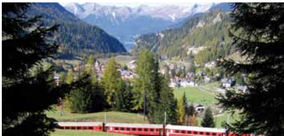
Ein starker Franken und hohe Produktionskosten belasten die Wettbewerbsfähigkeit der Tourismusbranche.

Die Ursache liegt in erster Linie in den weitaus höheren Lohn- und Warenkosten. Die Schweiz weist im Schnitt um 26 Prozent höhere Lohnstückkosten sowie 16 Prozent höhere Warenkosten aus. Im österreichischen Gastgewerbe sind die Lohn- und Warenkosten im Schnitt sogar 34 Prozent niedriger als in der Schweiz!