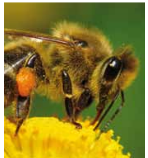
Das Bienensterben hat eine grosse Tragweite.