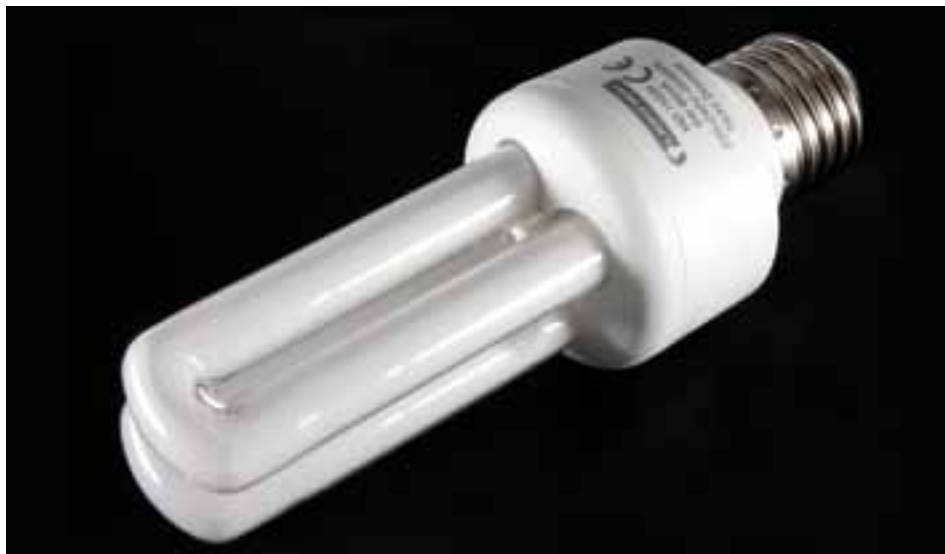
■ Bei einer ganzheitlichen Betrachtung schneiden Energiesparlampen nicht sehr gut ab.

Halogen- und Glühlampenlicht ist gleichmässig, weil der heisse Glühfaden auf die Netzfrequenz relativ träge reagiert. Anders bei den nach Leuchtstoffröhrenmanier gebauten Sparlampen: Deren Licht flackert hart und unharmlos im Takt von ausgeprägten Oberwellen, von Netz- und Elektronikfrequenzen. Keiner weiss, wie dieser Frequenzsalat biologisch verarbeitet wird. Im medizinischen Lexikon Psychorembel wird Sparlampenlicht als «Stressfaktor» ausgewiesen. Manche Menschen leiden unter Kopfdruck, Schwindel, Unwohlsein, Schwäche, Zittern, Nervosität, Kältegefühl und anderen unheilvollen Problemen.