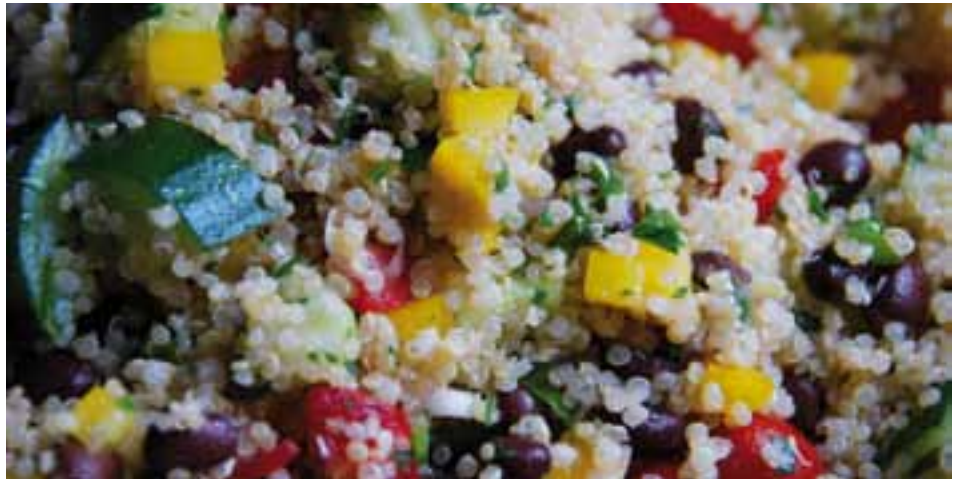
■ Quinoa, hier als Salat zubereitet: In Peru eines der wichtigsten Lebensmittel, in Europa nahezu unbekannt.

sich auch für die Herstellung von glutenfreiem Bier. Quinoa sollte unter fließendem heissen Wasser gewaschen und wegen Spuren von Bitterstoffen nicht an kleine Kinder abgegeben werden.