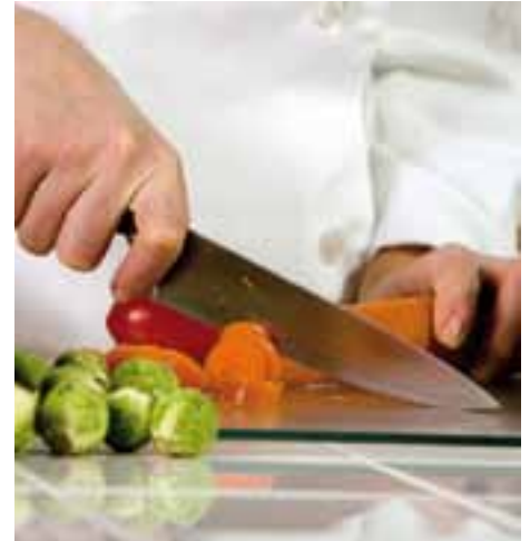
■ Die Suche nach Vertrautem führt zu einer starken Nachfrage nach regionalen Produkten.