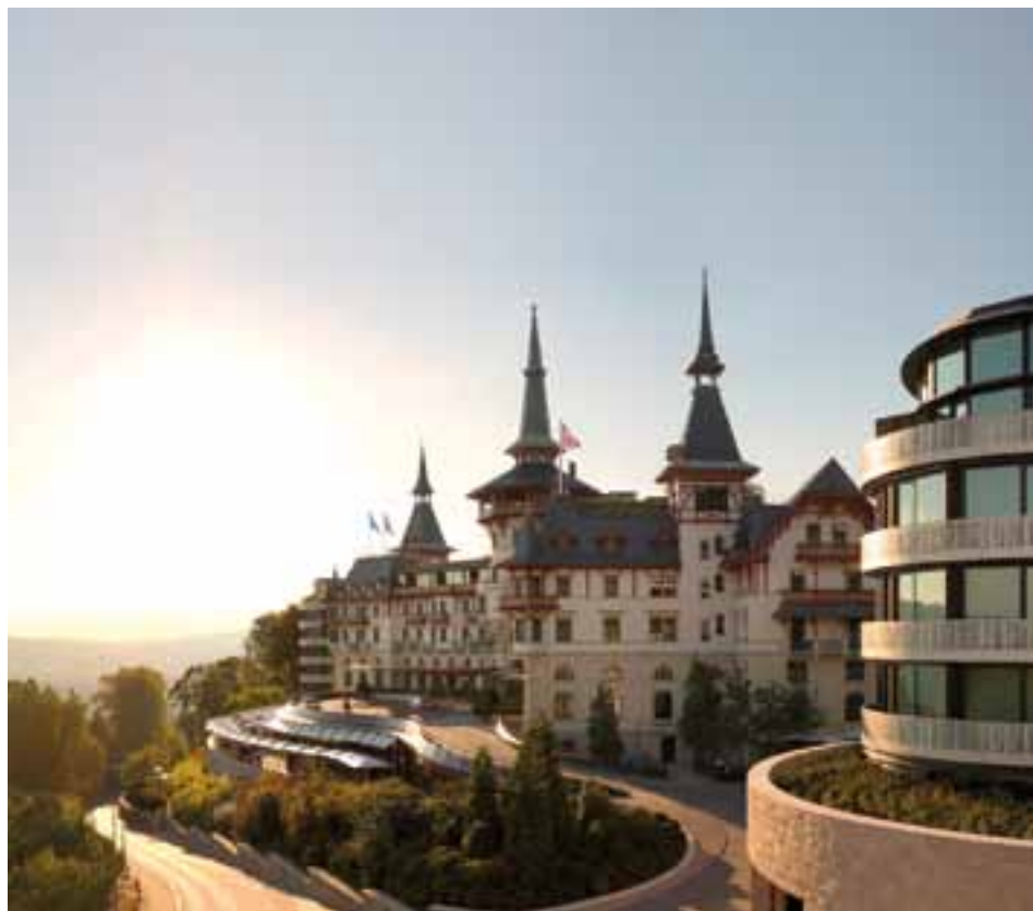
Die Auslastung im Dolder Grand ist so schlecht, dass ein Gebäudeteil vorübergehend geschlossen wurde.

Schweizweit gingen die Hotel-Logiernächte im Januar gegenüber dem Vorjahr um 5.8 Prozent zurück. Vor allem amerikanische, britische und russische Gäste machen zurzeit um die Schweiz einen Bogen. Zugelegt haben der chinesische und der japanische Quellmarkt.