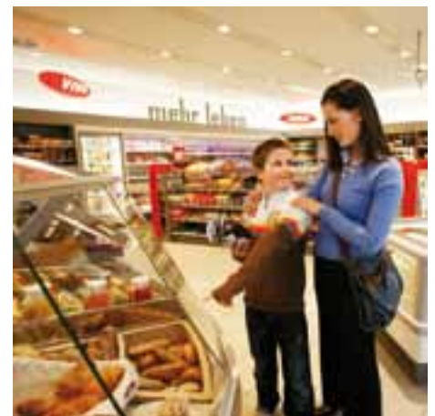
■ Ein Einheitssatz würde der Benachteiligung des Gastgewerbes gegenüber dem Detailhandel ein Ende bereiten.