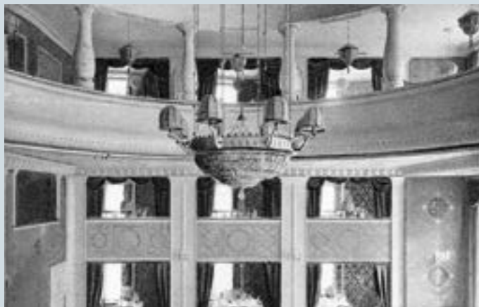
Das «Singer» am Marktplatz gehörte zu den spektakulärsten Kaffeehäusern in Basel (1917).

In der zweiten Hälfte des 19. Jahrhunderts entstanden in den Schweizer Städten zunehmend Kaffeehäuser und Konditoreiwirtschaften. Alkoholfreie Erfrischungsräume, ab den 1920er Jahren «Tea Room» genannt, galten als respektabler Ort, wo eine junge Frau alleine hingehen konnte. Selbst in der sittenstrengen Nachkriegszeit überlegte es sich eine Dame zweimal, wohin sie sich guten Gewissens von einem Verehrer zu einer warmen Schoggi oder einem Selleriecanapé ausführen lassen konnte.