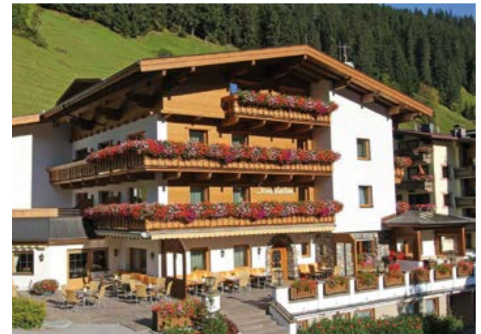
Die Berghotellerie in Österreich kämpft trotz Gästerekorden mit ähnlichen Problemen wie im übrigen Alpenraum.

Genauso wichtig: Praxisnähe. «Das hilft, unerwünschte Nebeneffekte und indirekte Belastungen zu verhindern, etwa bei der Begrenzung von Mietzuschlägen und strengeren Regularien für die Befristung von Mietverträgen. Dahinter steckt ein löblicher Gedanke, aber die Folge davon wären wieder mehr Wohnungen für die Sharing Economy und die Verlagerung von Wertschöpfung und Steuern ins Ausland.» Das koste Investitionen und Arbeitsplätze.