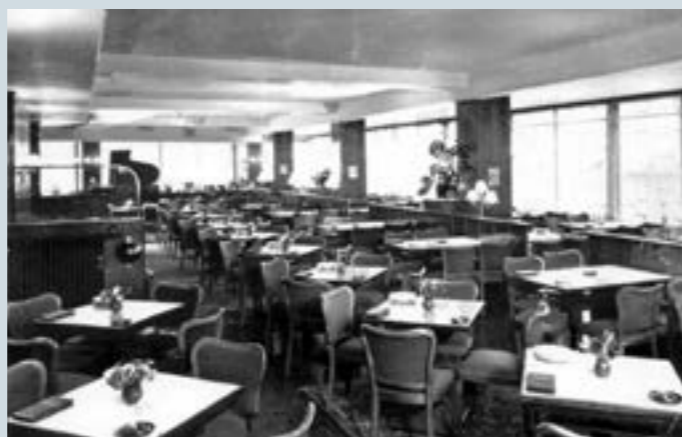
Im Wiener Stil: Grand Café Huğuenin am Barfüsserplatz (28. Mai 1963).