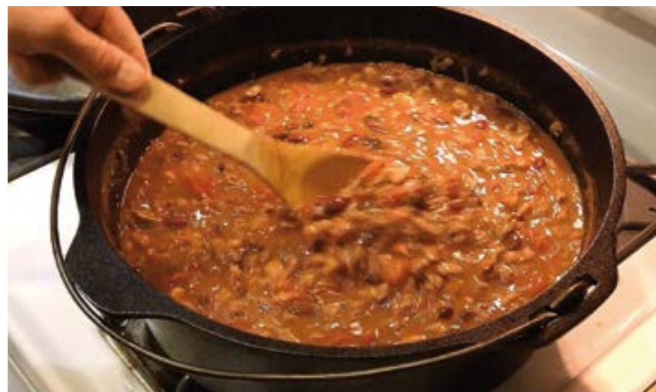
Es gibt Standbetreiber, die ihre Waren zuhause vorkochen und dann im Kofferraum zu ihrem Verkaufspunkt bringen.