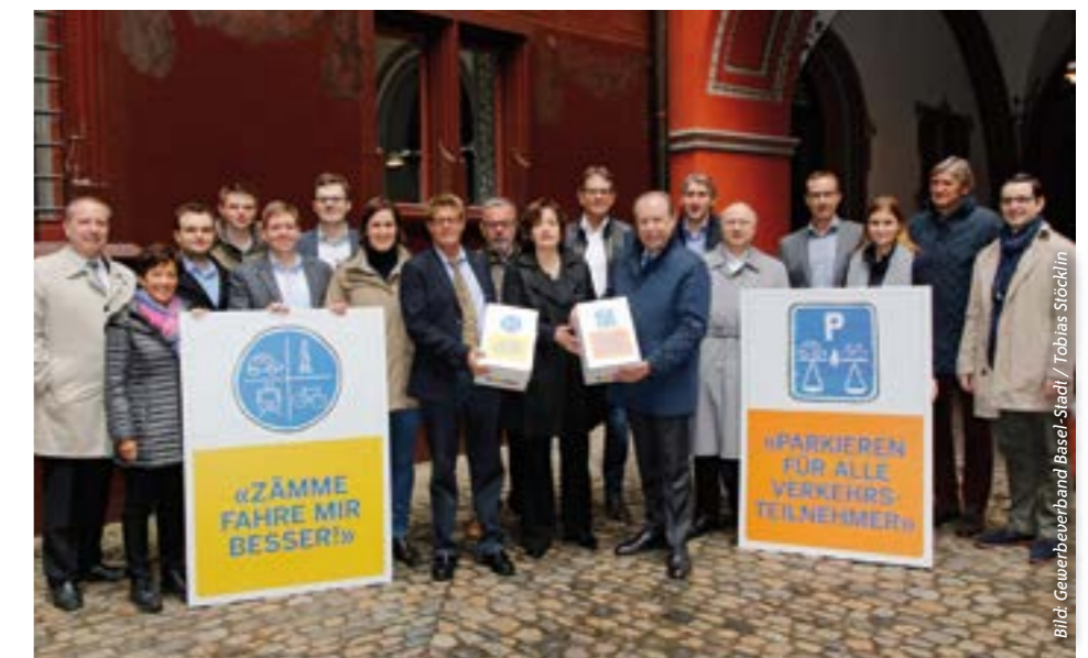
Der Gewerbeverband Basel-Stadt hat zwei Volksinitiativen gleichzeitig eingereicht.