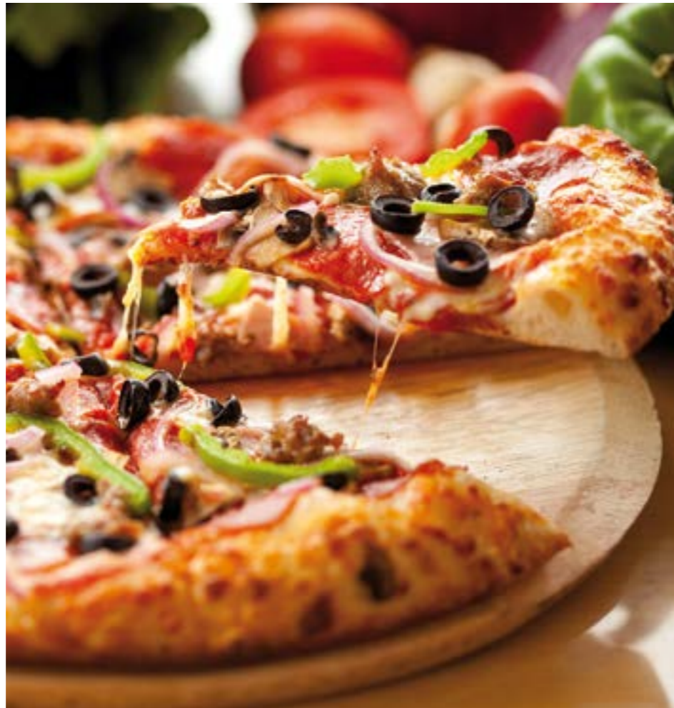
Jeder liebt sie: Bestseller Pizza.

Ganz so schlecht eignet sich Pizza nicht für Lieferungen – ausser vielleicht mit den Velo-Rucksäcken. Es gibt zumindest zahlreiche Speisen, die sich weit weniger eignen, weil sie noch schneller pampig werden, z.B. Pommes frites. Wird die Auswahl der Lieferdienste noch so gross: Die Pizza ist nicht tot zu kriegen!