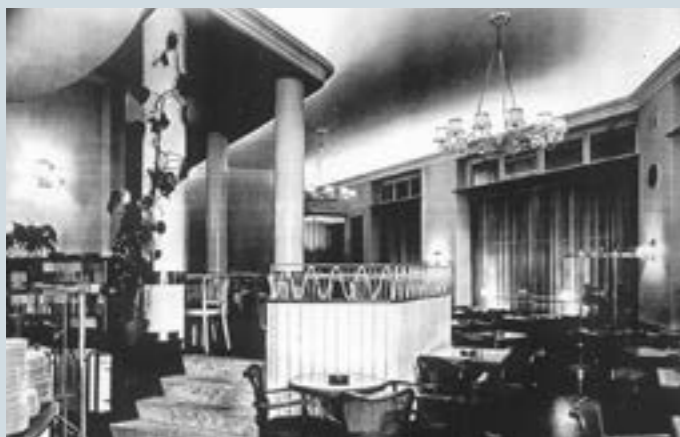
Teil eines Grossrestaurants gegenüber der Markthalle: Café Sattler (1965).