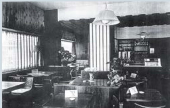
Heute Interdiscount: Café Mariza am Marktplatz (1965).