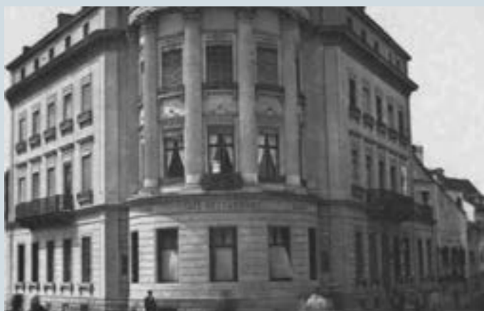
Pionierbetrieb: Café Restaurant Schilthof, eingangs Freie Strasse (1860).