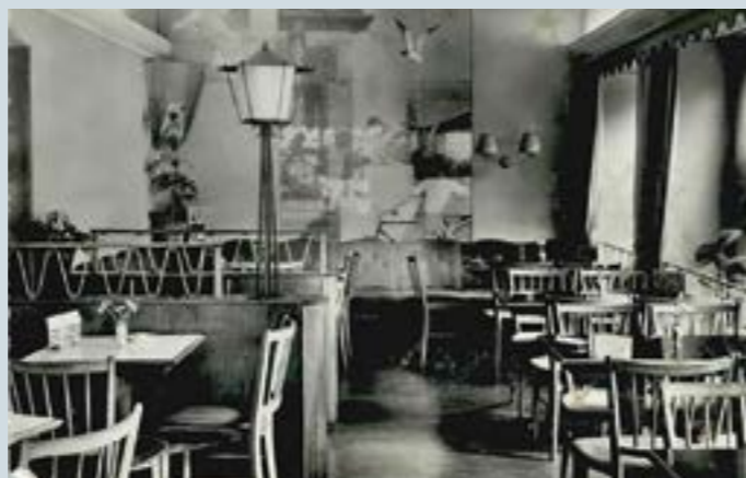
Das Café Käppelijoch an der Greifengasse.